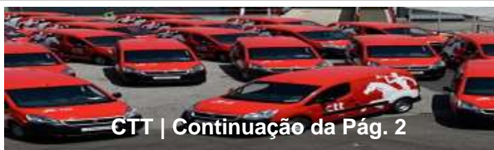
CTT | Continuação da Pág. 2

A USI – União dos Sindicatos Independentes , comemora este dia de uma forma autónoma e independente, demarcando-se das centrais político partidárias – CGTP e UGT , solidarizando – se com a luta dos trabalhadores a nível mundial e dos portugueses em particular na procura das melhores condições sociais, profissionais e laborais, pelo que o SICOMP, como Sindicato Autónomo e Independente se identifica com as iniciativas desta Confederação Sindical, na qual está filiado.